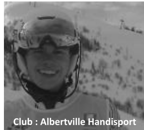
Club : Albertville Handisport