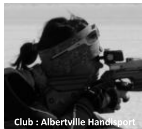
Club : Albertville Handisport