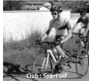
Club : Sport'Dif