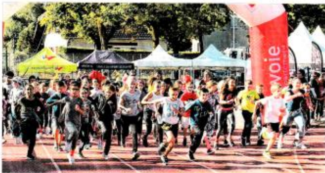
Tout au long de la journée, collègues des clubs de Savoie Grand, Savoie, membres de clubs sportifs ou d'associations, salariés d'établissements de secteur privé ou public, agents des collectivités territoriales, adultes et enfants accueillis dans un établissement spécialisé se sont réunis sur la piste du stade du Mas Barral à Chambéry.

Le Comité départemental handisport de Savoie a organisé, mercredi, sous le patronage de la Fédération française Amnésie de "La Savoie court pour handisport". L'événement a eu lieu dans le cadre de son action de promotion et de développement de la pratique d'activités physiques et sportives.