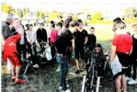
Les élèves de l'EP du collège René Fribourg ont tenu les bâtons pour promouvoir le handisport.