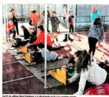
Les EP du collège Arret Courson à l'accueil de la 1 re à la condition sociale.