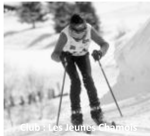
Club : Les Jeunes Chamois