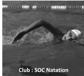
Club : SOC Natation