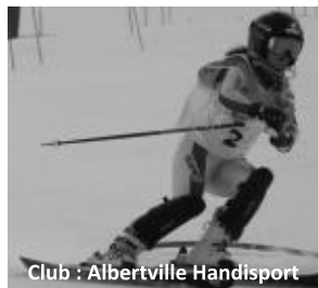
Club : Albertville Handisport