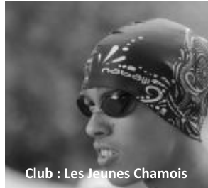
Club : Les Jeunes Chamois