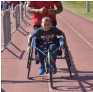
TEST " ATHLE KIDS "

Stand Infos (« Ecole et Sport », « Sport Santé en Savoie », « Le Handicap »...)