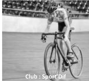
Club : Sport'Dif