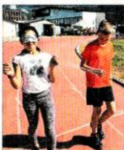
Parmi les nombreux ateliers, la marche les yeux bandés, accompagné.