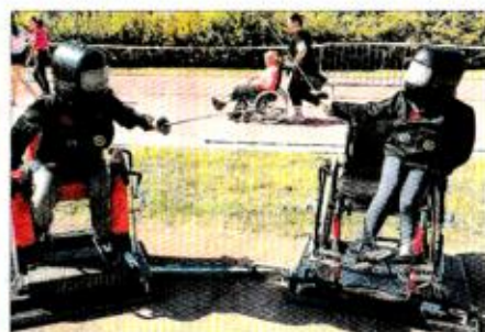
L'escrime en fauteuil.

Mercredi, une vingtaine d'enfants de l'Usep Cognin-S3C (Sport Culture et Citoyenneté) de Cognin, accompagnés de parents, se sont rendus au stade de Charrière Neuve pour participer à la 2 e édition de "La Savoie court