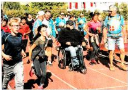
Salut et premiers en situation de handicap au cours assemblée pour ce défi sportif.