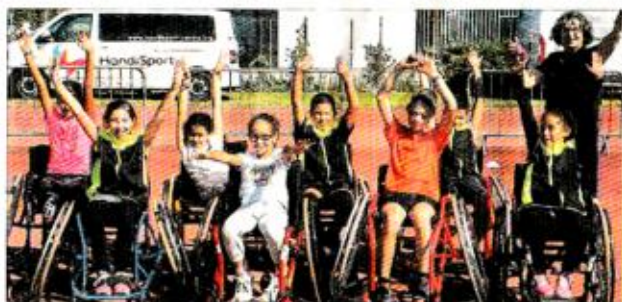
Pas facile le basket en fauteuil.