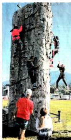
Les élèves de l'EP du collège Georges Sordani, à l'assaut de leur Everest.

- Établissements scolaires: collège Marcellin à Annecy-Bains, avec 657 km et 348 participants.