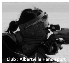
Club : Albertville Handisport