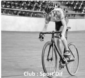
Club : Sport Dif