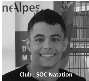
Club : SOC Natation