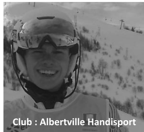
Club : Albertville Handisport