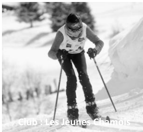
Club : Les Jeunes Chamois