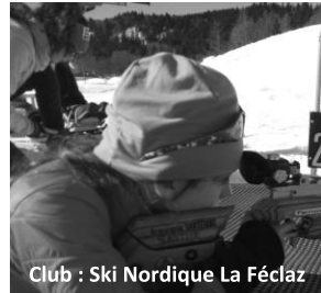
Club : Ski Nordique La Féclaz