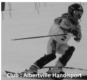
Club : Albertville Handisport