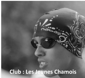
Club : Les Jeunes Chamois