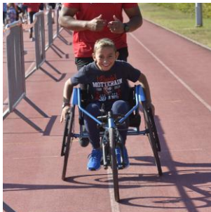
TEST " ATHLE KIDS "